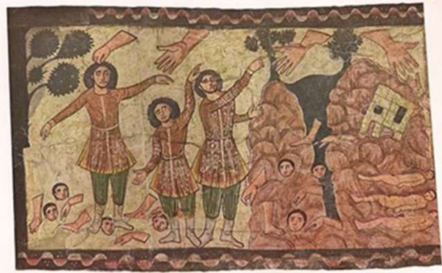
Abb. 4-5: Die Synagoge von Dura Europos: West- und Nordmauer und daraus Detail: Die Auferstehung der toten Gebeine Israels. Ez 37. https://www.bing.com/images/

Das üppigste Beispiel aus der Antike ist die Synagoge von Dura Europos (am mittleren Euphrat, heute in Syrien) aus dem 3. Jh. der Zeitrechnung. Hier die West- und Nordmauer der Synagoge und daraus ein Detail: Die Auferstehung der toten Gebeine Israels , Ez 37. [Abb. 4-5]