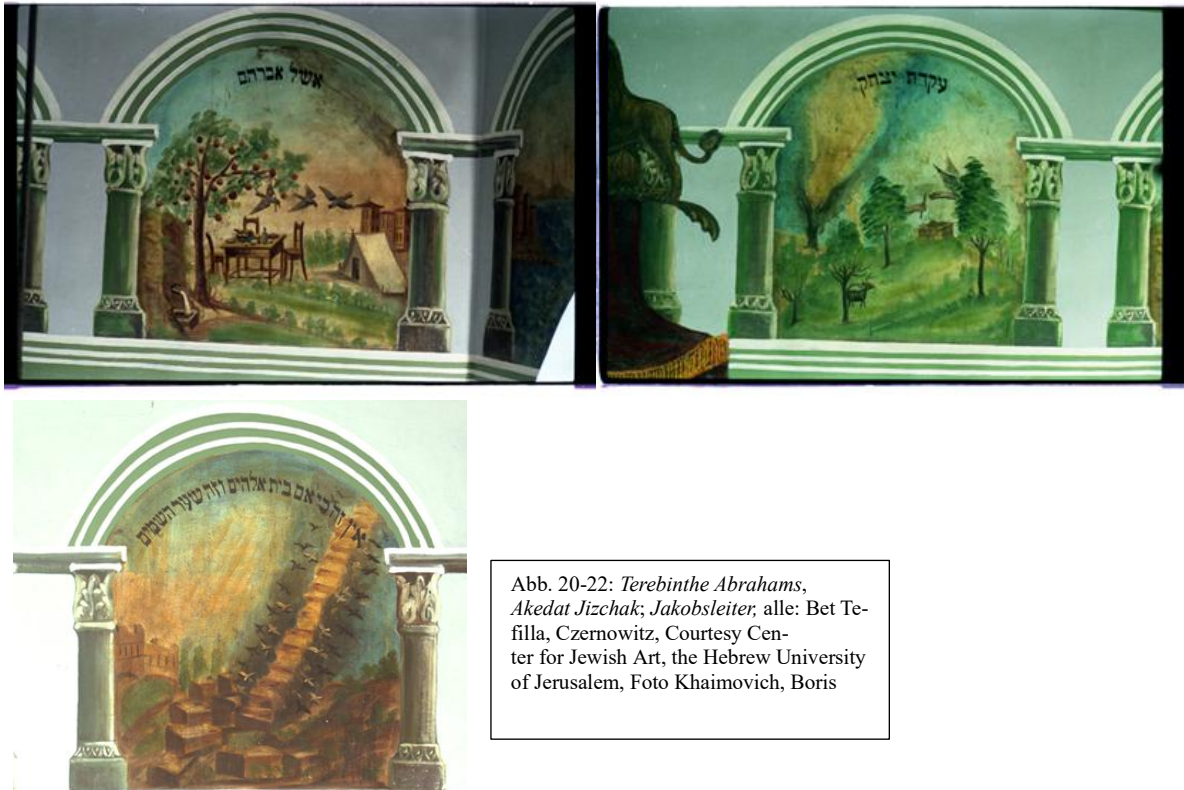
Abb. 20-22: Terebinthe Abrahams, Akedat Jizhak, Jakobsleiter , alle: Bet Tefilla, Czernowitz

Eine völlig neue Richtung nahm die Frage um die Darstellung von Menschen im Italien des 17. Jahrhunderts an. Die zahllosen Bilder von Menschen in der gesamten jüdischen Kunstgeschichte bis dahin, waren rein fiktive , nach den Vorstellungen der Künstler gezeichnete Menschen, niemals aber Gemälde von wirklich noch lebenden erkennbaren Personen. Das sollte sich mit der Renaissance ändern.