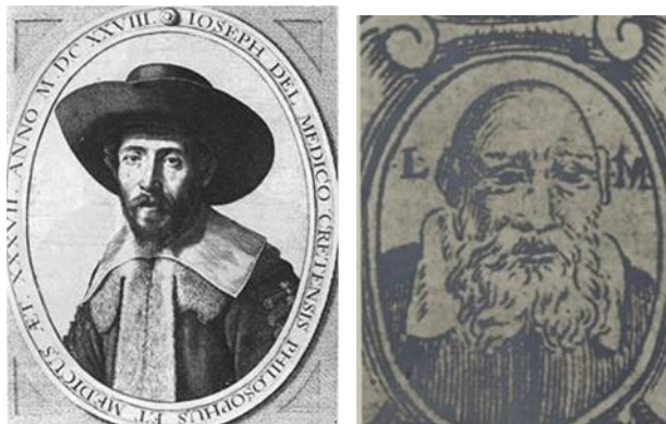
Abb. 24-25: Josef Schlomo Delmedigo (1591 – 1655); Jehuda Arjeh aus Modena (1571 – 1648), beide Wikimedia Commons

Eine völlig neue Richtung nahm die Frage um die Darstellung von Menschen im Italien des 17. Jahrhunderts an. Die zahllosen Bilder von Menschen in der gesamten jüdischen Kunstgeschichte bis dahin, waren rein fiktive , nach den Vorstellungen der Künstler gezeichnete Menschen, niemals aber Gemälde von wirklich noch lebenden erkennbaren Personen. Das sollte sich mit der Renaissance ändern.