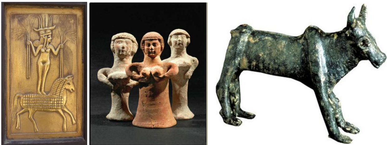
Abb. 1-3: Astarte, Goldplatte aus Lachisch 13. Jh., Israel Museum, Kanaanäische Aschera-Tonfigurinen, 8.-6. Jh.v.d.Z.; Bronze, Wettergott Ba'al (?) Region Sichem, entspricht den Goldenen Kalb der Bibel Ex 32

Der entscheidende Satzteil steht am Ende. Das Bilderverbot bezieht sich auf Götterbilder, wie sie im Kanaan biblischer Zeit sehr verbreitet waren. Etwa Bilder und die zahlreichen Ton-Figurinen der Göttin Aschera/Astarte, oder das Bildnis eines Stiers, entsprechend dem goldenen Kalb am