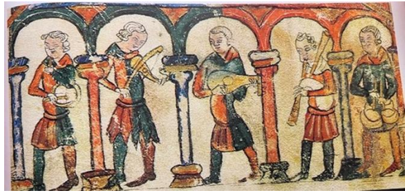
Abb. 16: Fünf Musikanten mit Tabor, Flöte, Fiedel, Laute, Dudelsack und Kesselpauken, Barcelona Haggada, 15. Jh., London, British Library, nach Die Jüdische Welt. Offenbarung und Geschichte , ed. E. Kedourie, dt. Vs. K.E. Grözinger, Frankfurt a.M. (S. Fischer) 1980

Es werden aber nicht nur biblische, sondern auch nachbiblische und gegenwärtige Motive gemalt, wie in dieser Darstellung von Musikanten mit zeitgenössischen Musikinstrumenten [Abb. 16].