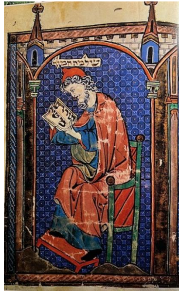
Abb. 12-13: Mirjam im Reigen mit den Frauen am Schilfmeer, Ex 1520, span. Goldene Haggada 14. J.h.; Der König Salomo beim Lesen der Tora, nordfranzösische Miniatur von 1278, beide: London, British Library; nach: Die Jüdische Welt. Offenbarung und Geschichte , ed. E. Kedourie, dt. Vs. K.E. Grözinger, Frankfurt a.M. (S. Fischer) 1980

Und natürlich wird das Sinaiereignis in allen Haggadot ausführlich dargestellt – hier zwei Haggadot aus Amsterdam aus dem 17. und 18. Jahrhundert [Abb. 14-15].