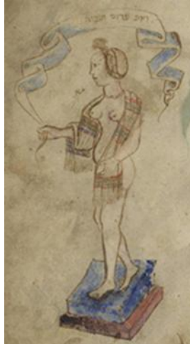
Abb. 8-9: Ez. 16, 7, Jerusalem »Deine Brüste wurden straff und dein Haar sprossste.«: Tegernsee Haggada Bayerische Staatsbibliothek Cod.hebr.200, um 1493; Rothschild Haggada ca. 1450, The National Library of Israel. Ktiv Project

Die Freiheit dieser jüdischen Kunst sieht man diesen beiden Bildern [Abb. 8-9] aus zwei deutschen Pesach-Haggadot aus dem 15. Jh. Es sind Illustrationen zum Gleichnis des Propheten Ezechiel für Jerusalem (Ez. 16,7): »Deine Brüste wurden straff und dein Haar sprossste.« Die biblische Geschichte wird – je nach dem Geschmack der Zeit – ausführlich dargestellt [Abb. 10-11]. So etwa die Opferbindung Isaaks, die schon oben am Beispiel von Bet Alpha zu sehen ist. Hier in zwei kunstgeschichtlich sehr verschiedenen Darstellungen aus dem 13. und 17. Jahrhundert.