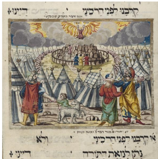
Abb. 14-15: Israel am Sinai, Haggada Amsterdam 1726, Beinecke Rare Book & Manuscript Library, Yale University; Israel am Sinai, Haggada Druck Amsterdam 1695, Jewish Cultural Center, Amsterdam